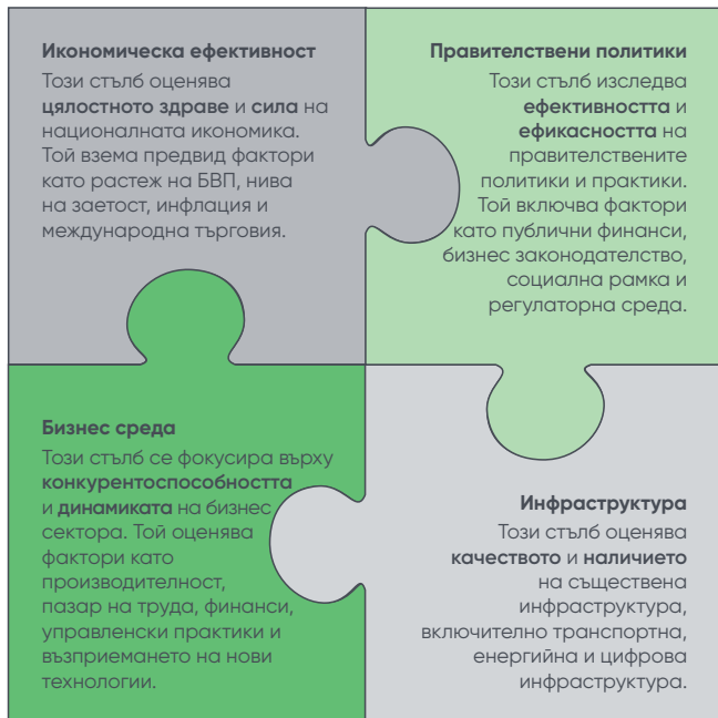
Фигура 1. Четирите стълба на световната конкурентоспособност